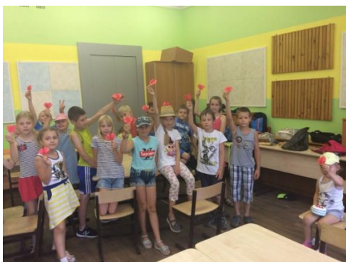
День любви и верности