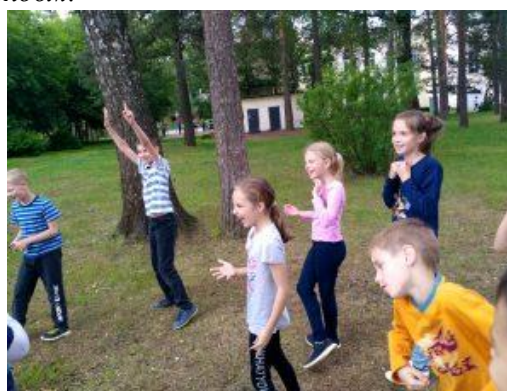
Всегда всем весело!