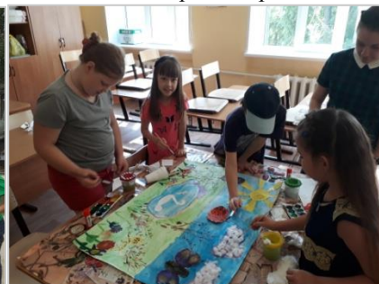
Занятия кружка «Юный художник»