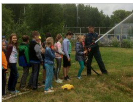
Экскурсия в пожарную часть