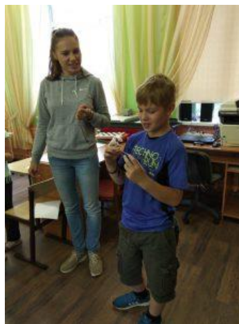
Играем всем отрядом!