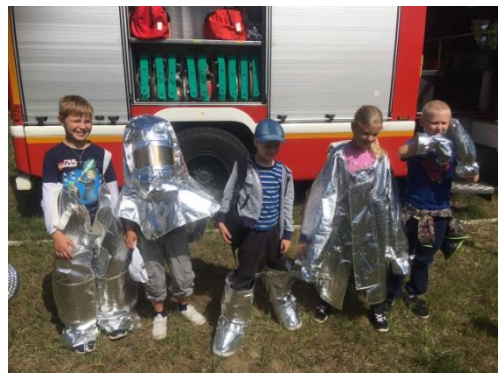
День пожарной безопасности. На экскурсии в пожарной части