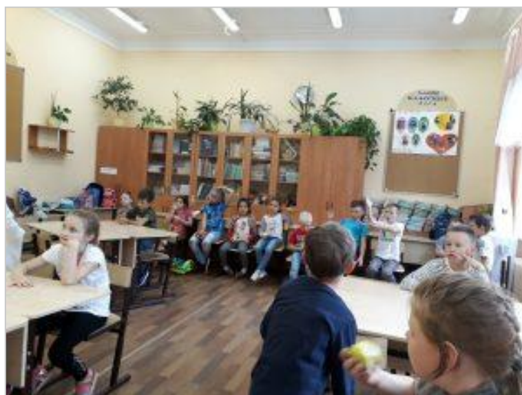
Участники викторины, 3 отряд