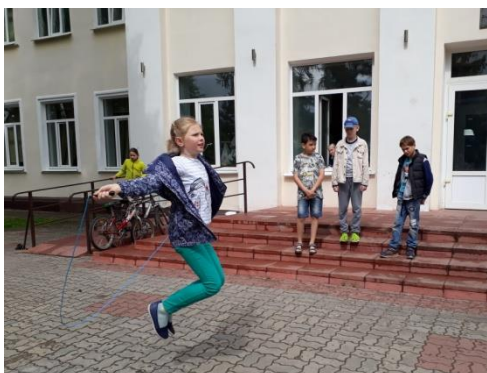
День спорта. Конкурс прыжков на скакалке