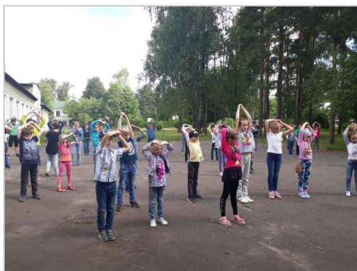
Фото отчёт о проведении утренней гимнастики в лагере «Солнечная поляна»