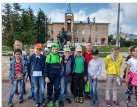
Поездка в г.Талдом