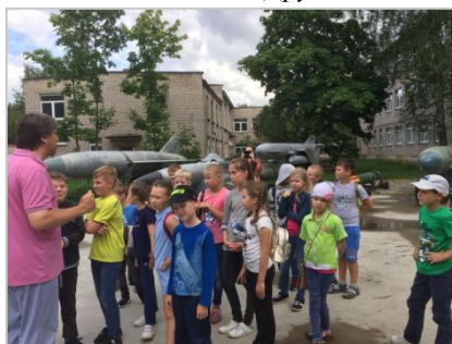
Экскурсия в музей крылатых ракет