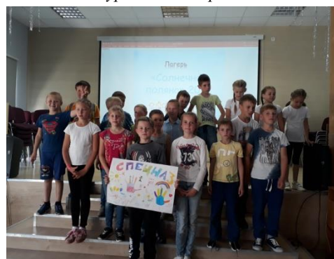
«День окончания лагерной смены. «Дорогою добра к новым открытиям»