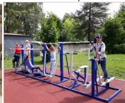
Все на тренажёры!