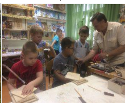
Занятия в КЮТ «Дружба»