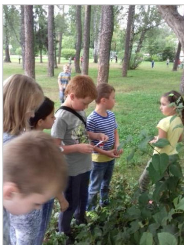
Фото отчёт «Играем в 12 записок!»

Таким образом, данную методическую разработку можно считать удачной формой воспитательного мероприятия, позволяющего активизировать разные способности детей в летнем городском лагере.