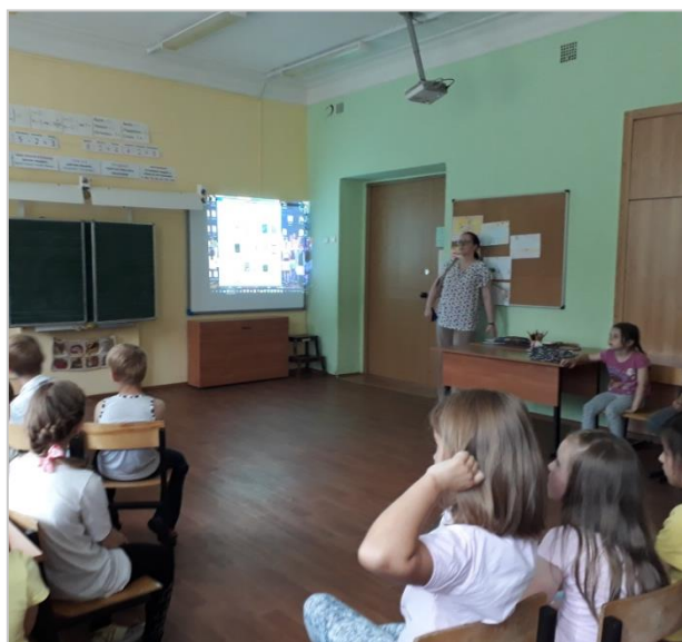
Участники викторины, 2 отряд