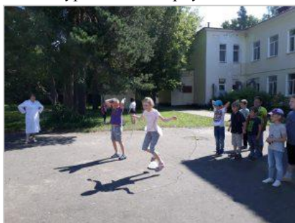
Первенство по прыжкам на скакалке