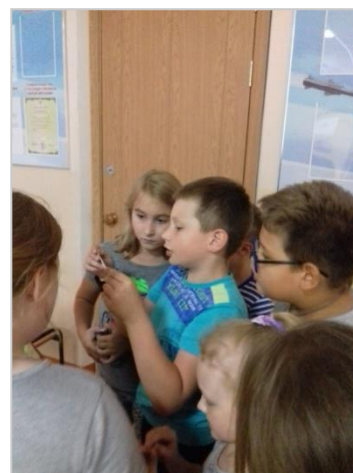
Воспитанники 3 отряда в поисках записок...